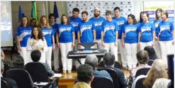
Coral do Cepel: apresentação elogiada