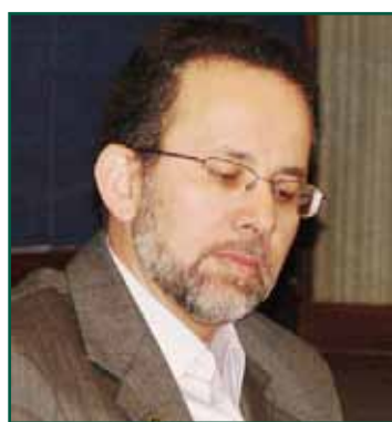
Auditor Dão Real

Daí, a conveniência de vincular a Aduana brasileira ao Ministério da Indústria e Comércio, e não à Receita Federal. “O problema é a Receita dentro de uma Aduana que não se submete aos interesses do comércio internacional, que não está comprometida com a arrecadação. Hoje, se uma carga tem suspeita de subfaturamento, a aduana dá perdimento. No MDIC, isso não interessa”, concluiu o Auditor.