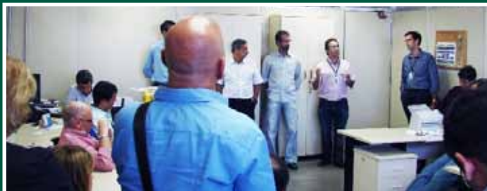
Reuniões na Inspetoria RJO: análise crítica sobre o futuro dos aduaneiros